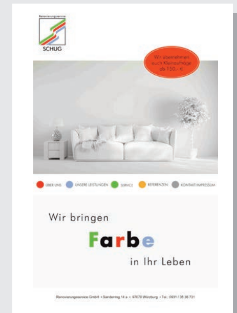
Broschüre zum blättern